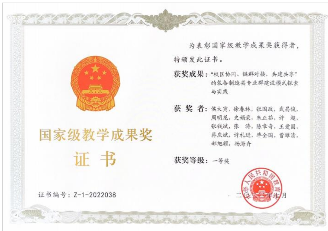
图 3 专业群建设模式获国家级教学成果奖一等奖

四是办学活力有效激发。 围绕关键指标，学校强化调研和配套制度建设，进一步提高二级学院自主管理、规范运行水平，学校服务能力、国际影响显著提升。2023 年获批国家“十四五”规划教材 4 本、省级“十四五”规划教材 6 本，在全国职业院校技能大赛中学生团队获国赛一等奖 1 项、二等奖 1 项、三等奖 5 项，教师团队获国赛二等奖、三等奖各 1 项，在中国国际大学生创新大赛（2023）中获国赛铜奖 2 项，获教师教学能力大赛省赛一等奖 2 项。2023 届毕业生去向落实率达 96.15%，留皖率达 75.86%，697 人进入本科院校深造。