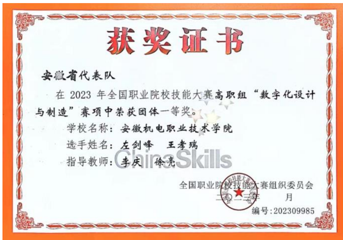
图 4 学生团队在 2023 年全国职业院校技能大赛中获高职组一等奖

五是师生幸福感满意度不断提升。 建成“实体+网上+掌上”的多场景服务模式，建成学生一站式服务中心，进一步为师生提供便捷服务，2023 年共开展校领导接访日活动 15 次，共登记受理信访件 4 件。高效完成教代会提案办理工作，提案办结满意度良好。充分利用政策，大大提高福利发放力度，节日福利慰问品发放已从 2017 年的人均每年 600 元提高到现在的人均每年 2300 元，全体教职工共沐党的温暖，共享改革成果。制定出台《关于对在职教职工工会会员结婚、生育、住院、荣休以及去世等五类情况给予相应慰问的通知》，实现了对教职工全方位的慰问。2023 年师生满意度超过 96%，师生获得感明显提升。