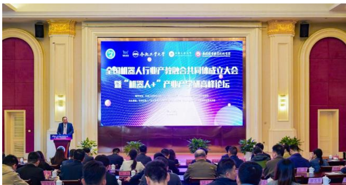
图 1 全国机器人行业产教融合共同体成立大会召开

二是开放共享办学成果显著。 学校牵头成立全国机械行业数字化设计与增材制造职业教育集团，汇聚行业资源，开展人才订单培养、现代学徒制培养，开发教材 8 本，建设省级增材制造教学资源库 1 个、省级精品课程 6 门、实训教学装备 10 多套，实现教学资源共建共享。与奇瑞汽车、埃夫特智能装备等企业合作共建奇瑞汽车产业学院联盟、工业互联网产业学院联盟等 8 个产业学院（联盟），成功立项工信部中小企业发展促进中心“专精特新产业学院”1 个。组建全国机器人行业产教融合共同体、全国增材制造行业产教融合共同体。先后选派多名优秀教职工到教育部职业教育与成人教育司、教育部职业教育发展中心、机械职业教育教学指导委员会等单位实践锻炼，学习借鉴新理念和先进经验，助力学校高质量发展。