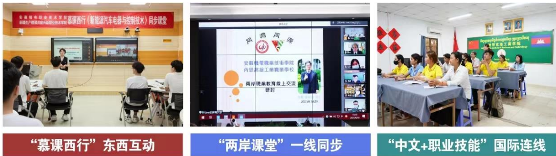
图 1 培训辐射半径

招生就业处等协同的科研与社会服务部门联席会议机制，共同推进社会培训、科教融汇等工作。